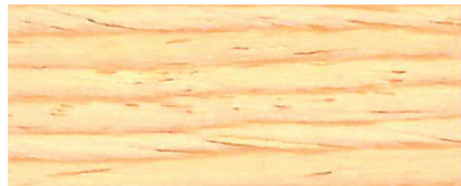
070 W INCOLORE