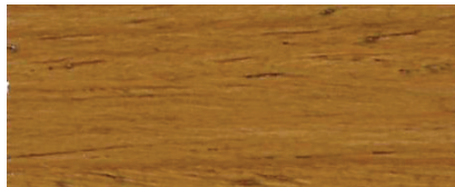
027 W NOCE