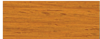
080 W CASTAGNO