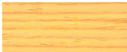
071 W PINO