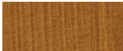
080 W CASTAGNO

*Il prodotto è realizzabile in tutte le tinte presenti nella cartella Novolegno all'acqua. La cartella colori è reperibile presso i rivenditori Cap Arreghini.