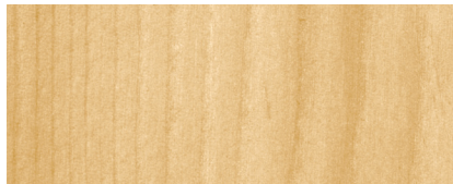
070 W INCOLORE