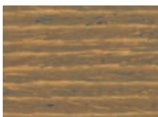
072 W NOCE CHIARO