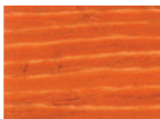
075 W MOGANO

*Le produit peut être réalisé dans toutes les teintes présentes dans le nuancier Novolegno à base d'eau. Le nuancier est disponible auprès des revendeurs Cap Arregghini.