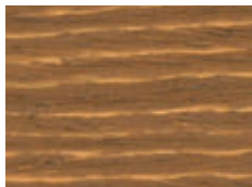
027 W NOCE