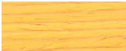
071 W PINO