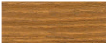
071 W NOCE