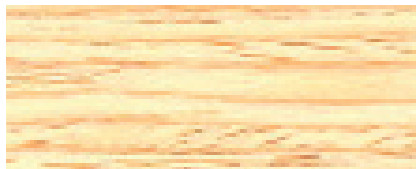
070 W INCOLORE